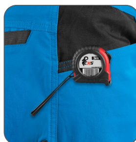
kapsa s vyztužením pro zavěšení metru vrecko s výstužou na zavesenie metra pocket with reinforcement for hanging a measuring tape kieszeń ze wzmocnieniem do zawieszenia miarki