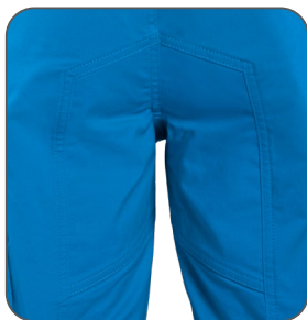
zesílený sed zosilnený sed reinforced seat wzmocnienie w kroku