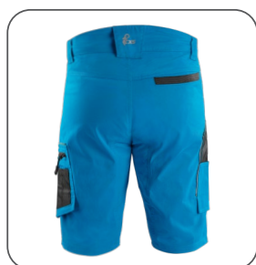
zadní strana zadná strana back side z tyłu